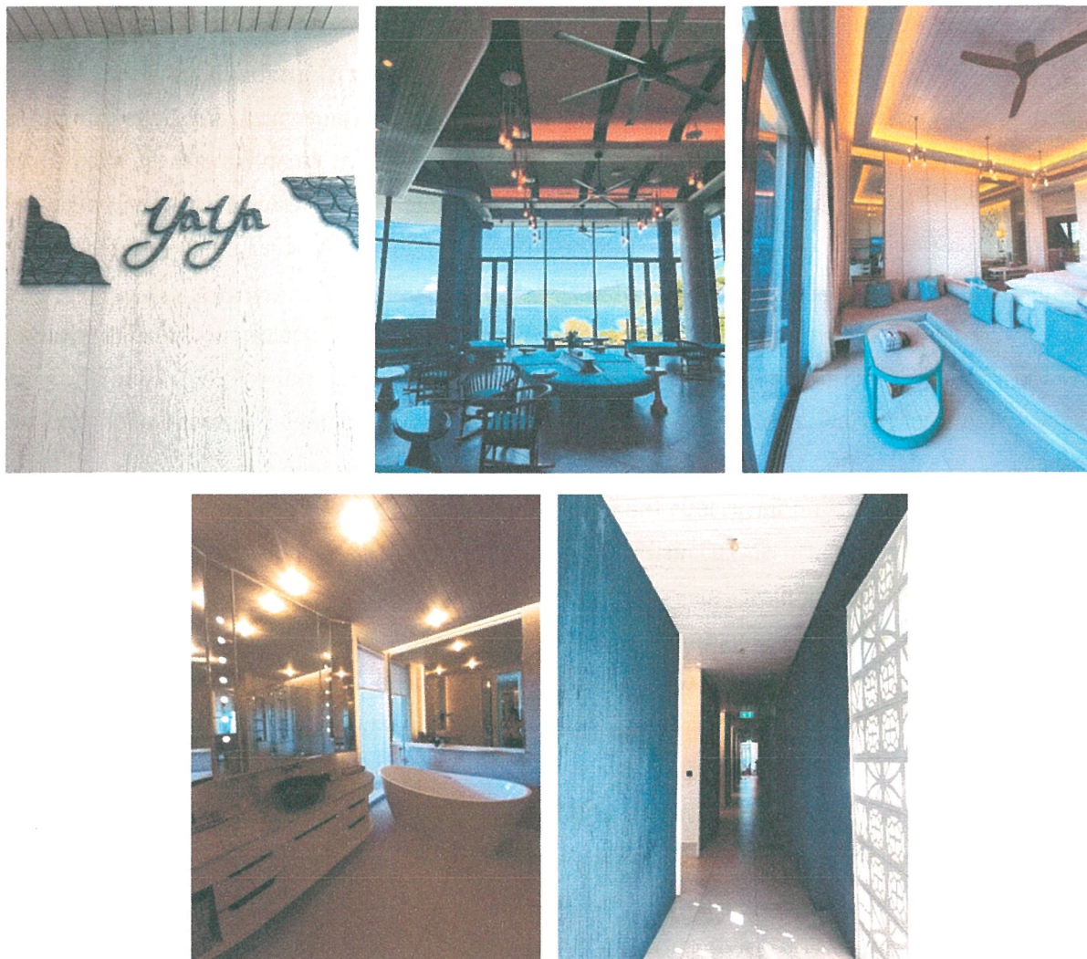
รูปภาพที่ 1.3 การใช้พื้นที่ของโครงการ